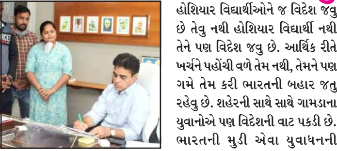
આજે કોઈ શાળા કે કોલેજના વર્ગખંડમાં જઈને પુછીએ કે કોને વિદેશ જવાની ઈચ્છા છે ? તો લગભગ ૫૦ ટકા વિદ્યાર્થીઓને વિદેશ જઈ કારકિર્દી બનાવવાનું સ્વપ્ન છે. આજે વિદેશ જવાનો જાણે વાયરો હુંકાયો છે પણ

પ્રતિનિધિ,ગાંધીનગર દેશ બહાર જતા વિદેશમાં અભ્યાસ કરવા જતા વિદ્યાર્થીઓને લઈ શિક્ષણમંત્રી પ્રફુલ પાનસેરીયાએ ચિંતા વ્યક્ત કરી છે. શિક્ષણ મંત્રી પ્રફુલ પાનસેરીયાએ કહ્યું કે દર વરસે ૮ લાખ વિદ્યાર્થીઓ વિદેશ ભણવા જાય છે. બાદમાં ત્યાં મોટી મોટી કંપનીઓના સીઈઓ બને છે. ગુજરાતી સીઈઓ જોઈને આપણે પણ કુલાઈ જઈએ છીએ પણ આ કુલાવાનો નહીં પણ ચિંતાનો વિષય છે. આપણે ક્યાં અહીં પ્રકારનું વાતાવરણ ન આપી શકીએ ?