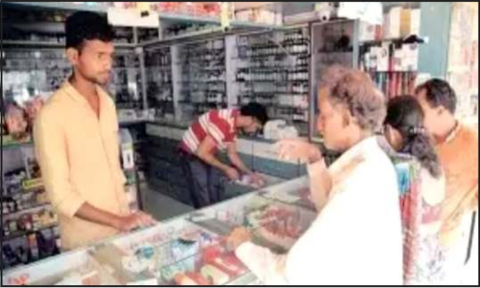
ચેકીંગ પણ થતું નથી. કેટલાક અધિકારીઓ રાજકીય લોભીમાં વર્ચસ્વ ધરાવતા હોવાથી નિવૃત્તિ પછી તેઓ અનેક એકસ્ટ્રેન્યુસ લઈ આવ્યા છે અને પોતાની પુરૂશી સલામત રાખી છે. લોકોના આરોગ્ય સાથે ચેડા કરતા આ વિભાગ પર સરકારે કે આરોગ્ય મંત્રીનું કોઈ નિયંત્રણ નથી. તપાસ કરતા જાણવા મળ્યું કે કેટલાક તોડબાજ અધિકારીઓ પોતાની દુકાન ચાલુ રહે તે માટે આ વિભાગમાં નવી ભરતી કરવા દેતા નથી. મેડીકલ સ્ટોર્સમાં એકપણ ધારાધોરણ કે નિયમોનું પાલન થતું નથી આરોગ્ય

પ્રતિનિધિ,ગાંધીનગર ગુજરાતના ૫૦ ટકા મેડીકલ સ્ટોર્સ ડ્રગ્સ એક્ટનો ભંગ કરી ફાર્માસિસ્ટની હાજરી વિના ધમધમી રહ્યા છે છતાં આરોગ્ય વિભાગ આંખઝાડા કાન કરી રહ્યું છે. હપ્તાબાજી અને તોડમાં લોકોના આરોગ્ય સામે જોખમ ઉભું થયું છે. ડ્રગ્સ કમિશન રેટના કેટલાક ભ્રષ્ટાચારી અધિકારીઓ ના કારણે દવાના કાયદાઓને નેવે મુકીને શંકાસ્પદ વેપાર થઈ રહ્યો છે. રાજ્યના અંદાજે ૪૦ હજાર કરતા વધુ મેડીકલ સ્ટોર્સ પૈકી ૩૫ ટકા રજીસ્ટર્ડ ફાર્માસિસ્ટ નથી, ૮૫ ટકા મેડીકલ સ્ટોર્સ ડોક્ટરના પ્રિસ્ક્રિપ્શન વિના બેફામપણે દવાઓ વેચી રહ્યા છે. જે કાયદાનું સંદર્ભ ઉલ્લંઘન થઈ રહ્યું છે. રાજ્યના મોટાભાગના મેડીકલ સ્ટોર્સમાં આવી પ્રવૃત્તિ ધમધમી રહી છે અને તેની જાણ ડ્રગ્સ કમિશન રેટના અધિકારીઓને હોવા છતાં પગલા લેવાતા નથી. રાજ્યમાં ડ્રગ્સ ઈન્સ્પેક્ટરોની ભારે અછતાનું કારણે આ નિયમિતપણે સરપ્રાઈઝ