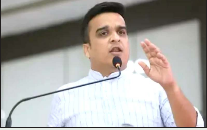
આપણે સતર્ક બનીને જોવાનું છે, કોઈ ગુન્હેગાર પોલીસ સ્ટેશનમાં આવે અને મહેસાનગતિ કરવામાં આવે તેવી પરીસ્થિતિ ડીજીપી સુધી ન પહોંચે તેની ફરીયાદીની આશા છુટી જાય છે, પણ પોલીસે ફરીયાદીને આપેલો વિશ્વાસ તુટવા ન દેતા પોલીસની આશા અકબંધ રહે છે. તેનું જ પરિણામ એટલે તેરા તુજકો અર્પણ, કાર્યક્રમ મંદિરની જવાબદારી છે. મંત્રીએ વધુમાં કહ્યું કે ફરીયાદી વિશ્વાસથી પોલીસ સ્ટેશન

તસવીર યુનુસ મેમણ પ્રતિનિધિ,ગાંધીનગર ગાંધીનગરમાં તેરા તુજકો અર્પણ કાર્યક્રમ યોજાયો હતો. જેમાં ૪૩૦ અરજદારોને તેમના મોબાઈલ પરત આપવામાં આવ્યા હતા આ કાર્યક્રમમાં રાજ્યના ગૃહ મંત્રી હર્ષ સંઘવી પણ ઉપસ્થિત રહ્યા હતા. તેઓએ ગુન્હેગારોને લઈને પોલીસ કેવી હોવી જોઈએ તે અંગે ટકોર કરી હતી. મંત્રી સંઘવીએ કહ્યું કે પોલીસ કર્મીઓને આપેલો દંડો છુટથી વાપરવો જોઈએ, ગુન્હેગાર જે ભાષા સમજે તે ભાષા થી સમજાવે તેને પોલીસ કહેવાય, હર્ષ સંઘવીએ પોલીસ અધિકારીઓની હાજરીમાં કહ્યું હતું કે સામાન્ય નાગરિકો જયારે પોતાની ફરીયાદ લઈ પોલીસ સ્ટેશન આવે ત્યારે તેમના માન સન્માનની જવાબદારી પણ સૌ પોલીસ કર્મીઓની છે. પણ ગુન્હેગાર મહેસાનમની જલસા ન કરે એ પણ